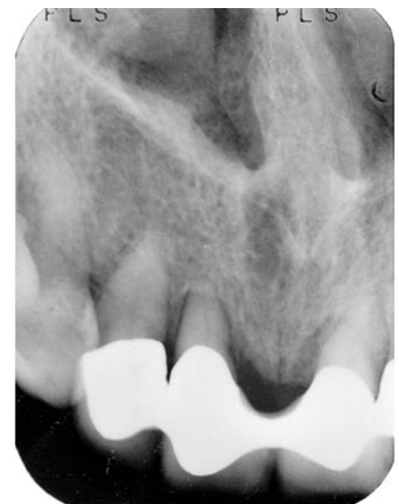
Abb. 4: 11.1.01 Zustand nach Pa-Therapie und Core