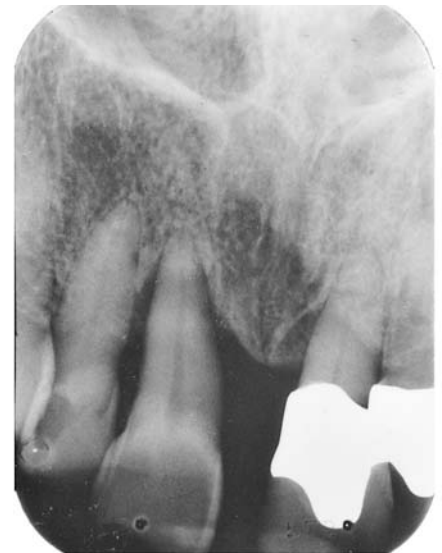
Abb. 3: 11.4.00 Zustand vor Pa-Therapie und Core

(3) Spiritual Nutrition and the Rainbow Diet von Gabriel Cousens, Cassandra Press 1986 □