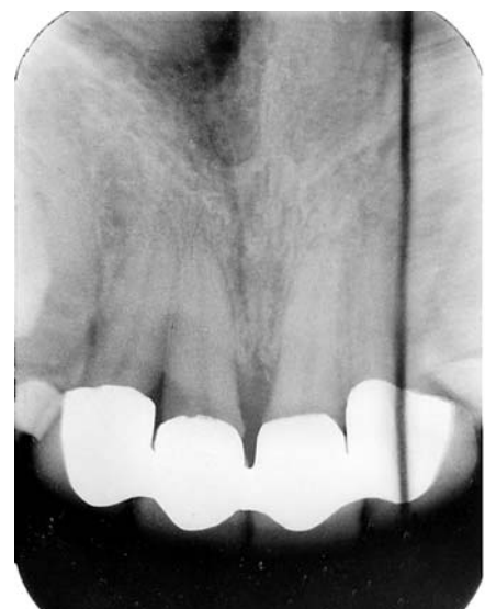
Abb.5: 2.01 Röntgenbild des Guttachers